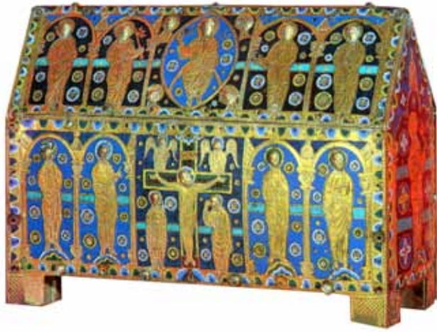
Châsse en émail champlevé de Cassan, XIII ème siècle (Montpellier, Musée languedocien)

communes des actuels départements de l'Hérault, de l'Aude, du Tarn et de l'Aveyron : champs, vignes, olivettes, hermes, prés, forêts, garrigues, étangs, moulins, rivières et rivages, maisons, pigeonniers, fours, granges, mas, du bétail, des droits et redevances, la seigneurie et justice sur pratiquement tous ces biens, sur les villages de Coulobres et de Veyran, et sur deux hôpitaux-hôtelleries (Cassan et l'Hospitalet-du-Larzac 2 ).