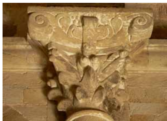
De haut en bas et de gauche à droite Prievrale romane Sainte-Marie de Casan Vierge à l'Enfant Lanternon, dessin d'Eugène Viollet-le-Duc (Ministère de la Culture, Médiathèque de l'architecture et du patrimoine) Chapiteau et tailloir