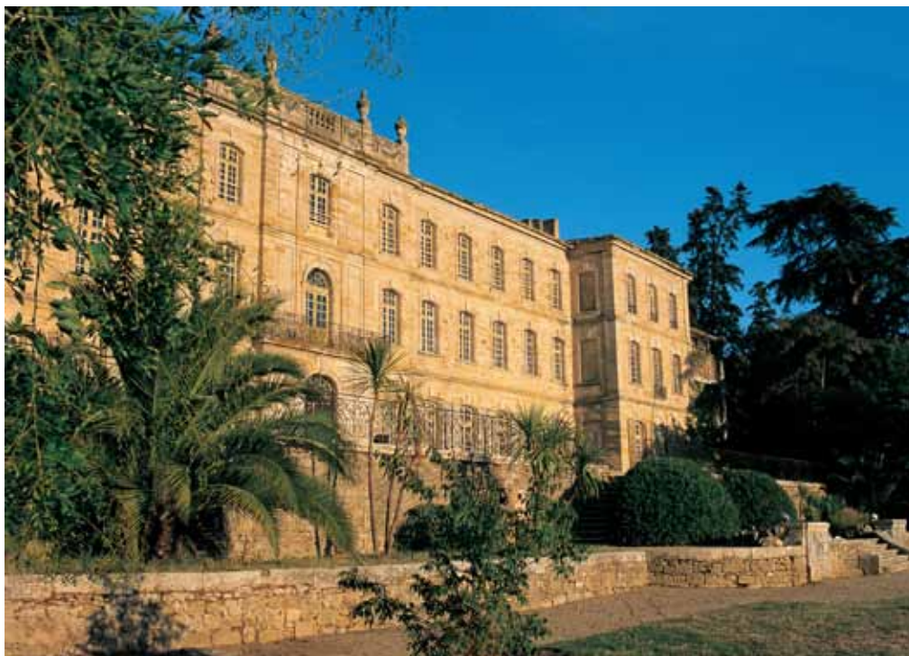
Façade ouest du prieuré de Cassan, XVIII ème siècle

Malgré la réforme réalisée lors du rattachement à Saint-Ruf, le déclin amorcé au XIV ème siècle s'aggrave fortement dans les siècles suivants. A tel point qu'en 1605, lorsque l'évêque de Béziers, Jean de Bonsy, fait sa visite pastorale de l'église, il ne reste plus que 7 ou 8 chanoines.