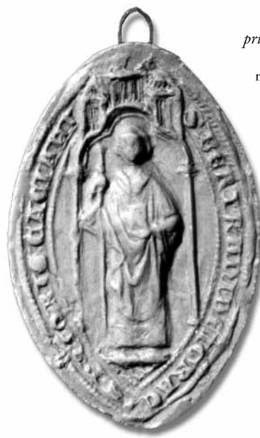
Sceau de Bertrand, prieur de Cassan (1303) (Paris, Archives nationales, J 478, n° 10)

5. Tout près, les mercenaires incontrôlés des Grandes Compagnies se sont emparés de Gabian pourtant puissamment fortifié, et y sont demeurés pendant quatre ans, avant d'en être chassés en juin 1364 par le maréchal d'Audeneham et le futur connétable, Bertrand du Guesclin.