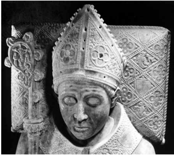
Gisant de Guillaume Durant le Jeune, évêque de Mende (Toulouse, Musée des Augustins)