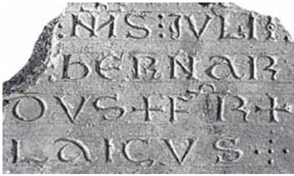
Épithaphe de Bernard, frère laïc, XII ème siècle (Château de Cassan, aujourd'hui disparue)

Guiraud accède à la prêtrise en 1101. Sa sagesse, son érudition et ses vertus chrétiennes peu communes - humilité, admirable simplicité, chasteté, grande piété, souci extrême de la célébration la plus parfaite du culte, et amour profond du prochain - le font élire tout naturellement à la tête du prieuré à la mort de Teudald en 1106.